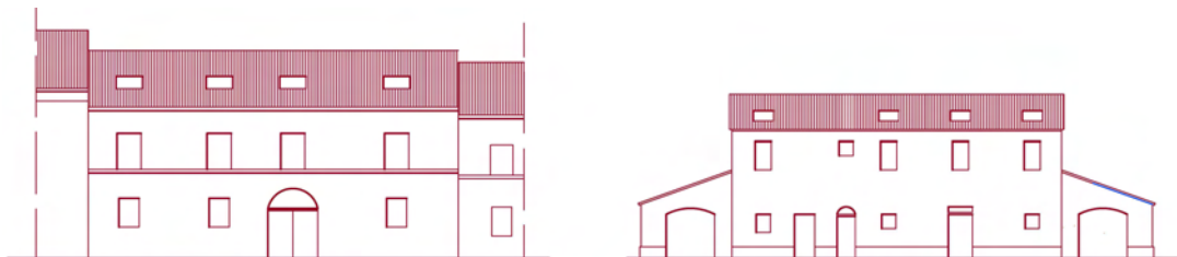
Schemi grafici esemplificativi dell'inserimento di finestre in falda coerenti con il sistema delle aperture esistenti.