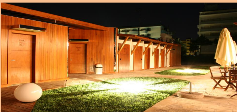
Stabilimento Balneare CASTA BEACH, 259 Milano Marittima (RA)